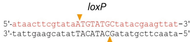
图1. loxP位点序列图。Cre重组酶与两端13bp反向重复序列(小写字母)结合, 中间是8bp不对称中心间隔区(大写字母), 箭头所示为Cre重组酶的酶切位点。